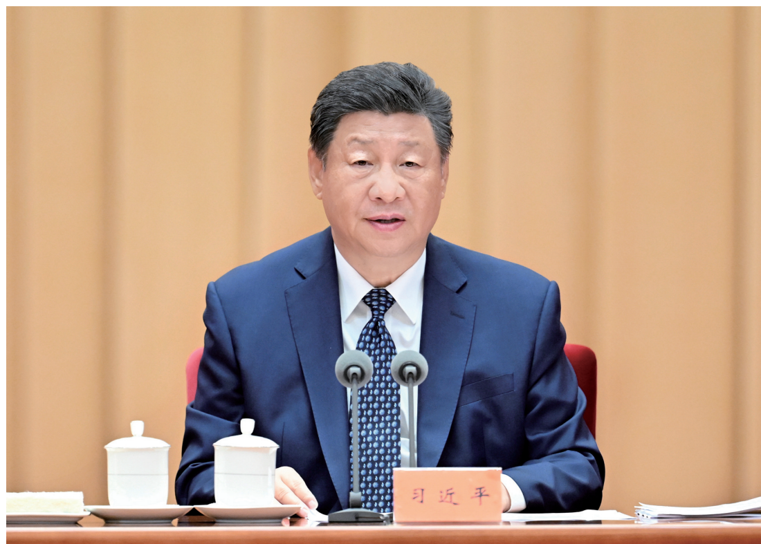
9月27日,全国民族团结进步表彰大会在北京举行。中共中央总书记、国家主席、中央军委主席习近平出席大会并发表重要讲话。新华社记者 谢环驰 摄