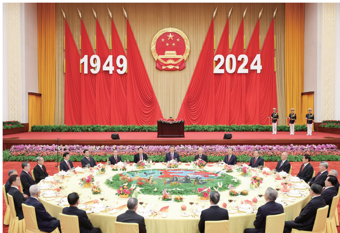
9月30日晚,庆祝中华人民共和国成立75周年招待会在北京人民大会堂隆重举行。习近平、李强、赵乐际、王沪宁、蔡奇、丁薛祥、李希、韩正等党和国家领导人与约3000名中外人士欢聚一堂,共庆新中国75周年华诞。

新华社北京9月30日电 庆祝中华人民共和国成立75周年招待会30日晚在人民大会堂隆重举行。中共中央总书记、国家主席、中央军委主席习近平出席招待会并发表重要讲话。他强调,中华人民共和国成立75年来,我们党团结带领全国各族人民不懈奋斗,创造了经济快速发展和社会长期稳定两大奇迹,中国发生沧海桑田的巨大变化,中华民族伟大复兴进入了不可逆转的历史进程。新时代新征程,中国人民必将创造出新的更大辉煌,必将为人类和平发展的崇高事业作出新的更大贡献。