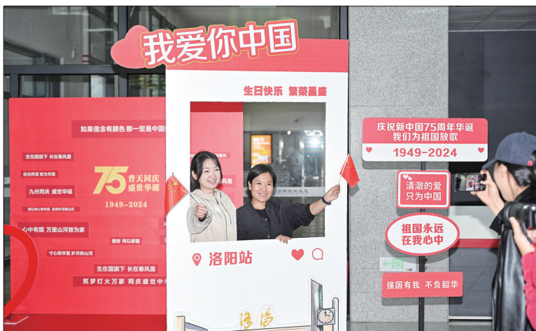
旅客在洛阳站候车厅迎国庆打卡点拍照