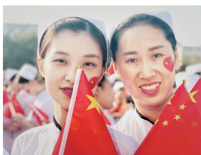
我爱我国