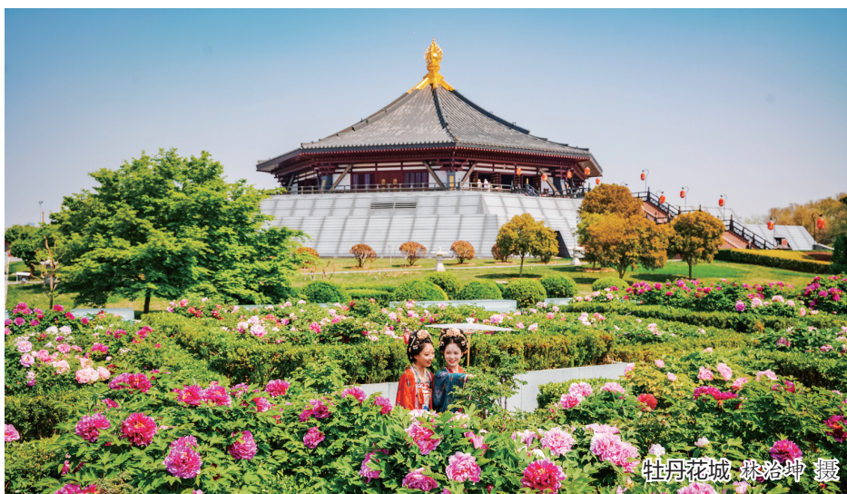
牡丹花城