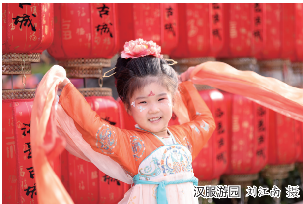
汉服游园

为庆祝中华人民共和国成立75周年,洛阳市委直属机关工委举办了“奋进新时代 礼赞新中国”随手拍活动,征集反映洛阳发展成就、美丽风光和进取风貌的摄影作品,收到了一批主题健康、角度独特、画面生动,具有较强艺术性和感染力的作品。这些作品以小见大,讴歌新时代,展现新成就。本报今日刊发第二批优秀作品,以飨读者。