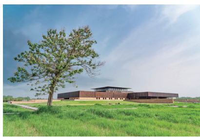
最早的中国