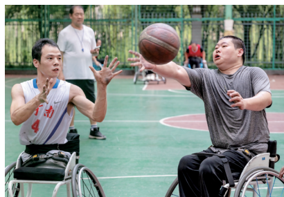
力量和希望