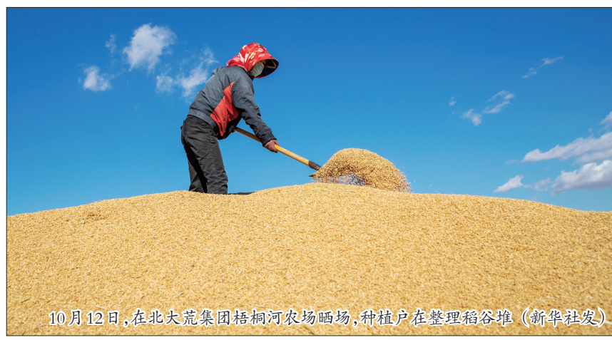
10月12日,在北大荒集团梧桐河农场晒场,种植户在整理稻谷堆

2024年世界粮食日和全国粮食安全宣传周主场活动在武汉举行,由国家粮食和物资储备局、农业农村部、教育部、全国妇联共同主办。