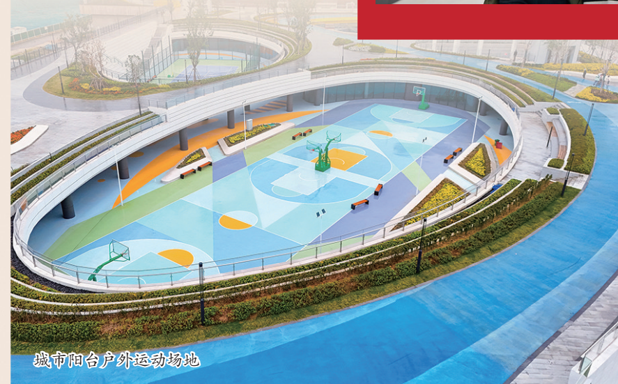
城市阳台户外运动场地