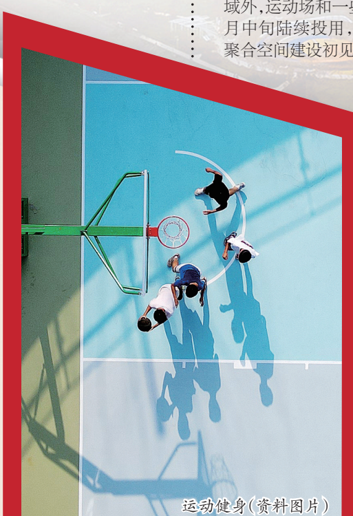
运动健身(资料图片)

如今,前来城市阳台打卡的市民越来越多。流畅的造型姿态、立体的动线组织、丰富的空间流转、开阔的视野景致……不少市民纷纷赞叹:“城市阳台很‘潮’,很有大城市的时尚感。”