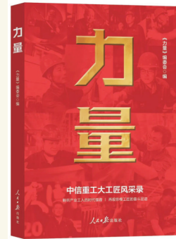
《力量——中信重工大工匠风采录》

近日,记者从中信重工获悉,报告文学集《力量——中信重工大工匠风采录》一书日前由人民日报出版社正式出版,面向全国公开发行。