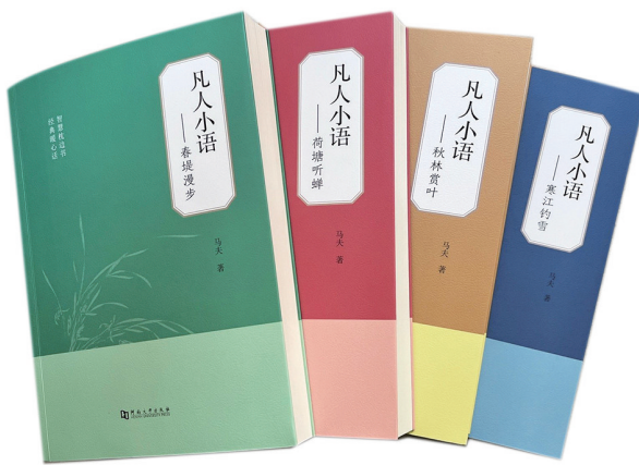
《凡人小语》(资料图片)