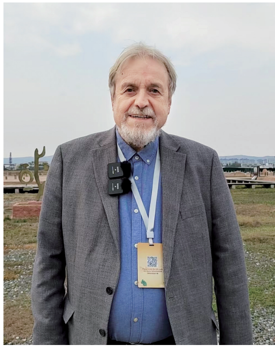
弗拉基米尔·马良文