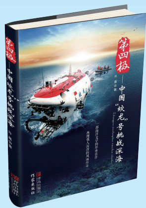
《第四极——中国“蛟龙”号挑战深海》作家出版社