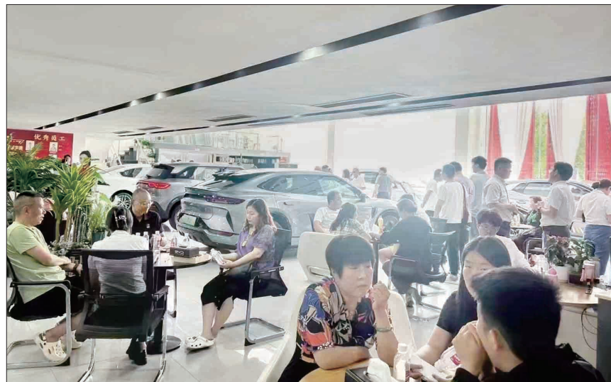
某汽车销售大厅内咨询者络绎不绝(资料图片)