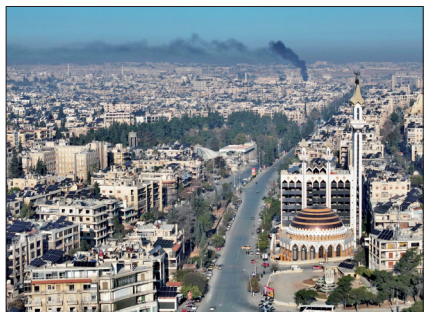
这是11月30日在叙利亚阿勒颇拍摄的街景

此外,巴沙尔当日还与伊拉克总理苏达尼通话,讨论了叙伊两国在反恐领域的合作。苏达尼强调“叙利亚与伊拉克的安全是一体的”,并表示愿意向叙