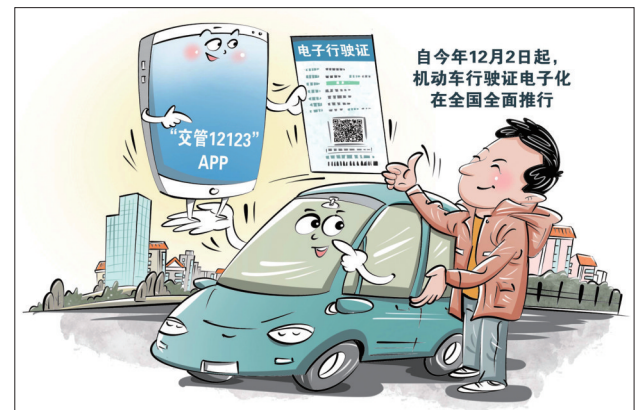
电子行驶证全面推行

最高检、公安部有关部门负责人表示,全国检察机关、公安机关将继续加强协作配合,全力推进“打防管控建”各项工作措施,全力缉捕、从严惩治跨境电信网络诈骗犯罪集团头目、幕后“金主”和骨干成员,有力斩断犯罪链条,全力追赃挽损,坚决维护人民群众合法权益和生命财产安全。