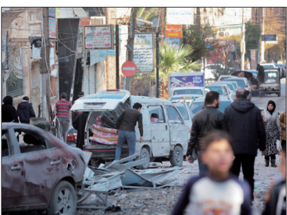
11月30日,人们经过叙利亚阿勒颇的一处受创道路