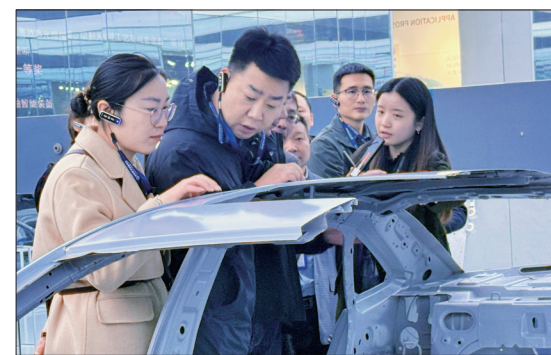
学员们学习企业科技创新经验

本报讯（洛报融媒记者 李雅君 通讯员 来瞻）日前，市委党校开展异地教学，组织2024年秋季学期乡科级干部进修班学员到湖北武汉考察学习，通过专题授课、现场教学相结合的方式，引导学员开阔视野、解放思想，博采他山之石，推动高质量发展。