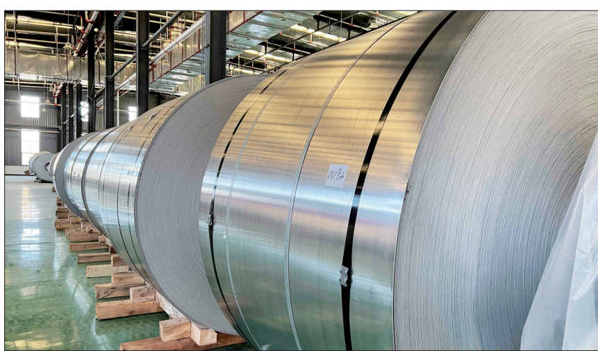
洛阳综保区仓库内存放的铝产品