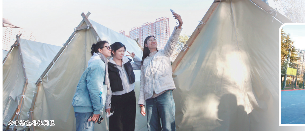
咖啡馆室外休闲区