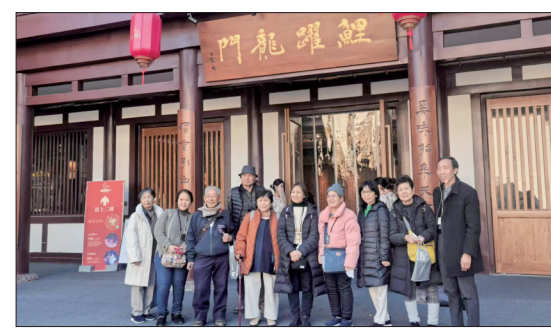
日本法政大学旅行团在洛游览

本报讯（洛报融媒记者 戚仲华 通讯员 崔志鹏）自11月30日起，我国对日本、保加利亚等9国持普通护照人员试行免签政策。12月1日，我市迎来首批享受免签新政的入境游客——日本法政大学旅行团。