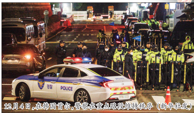
12月4日,在韩国首尔,警察在重点路段维持秩序

有分析认为,韩国朝野围绕下一年度预算案的纷争是尹锡悦突然发布紧急戒严令的导火索,背后凸显朝野斗争趋于白热化以及尹锡悦政府“跛脚鸭”压力日益加剧。此外,近期在野党推动针对尹锡悦夫人的系列立法以及弹劾检察官等公职人员,也或是尹锡悦此举的触发因素。