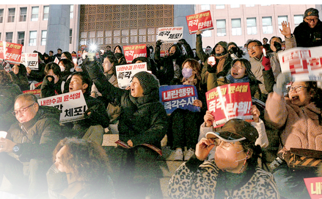
12月4日,韩国民众在首尔的国会大厦台阶上参加抗议活动,要求总统尹锡悦辞职