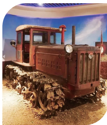
东方红-54型履带式拖拉机