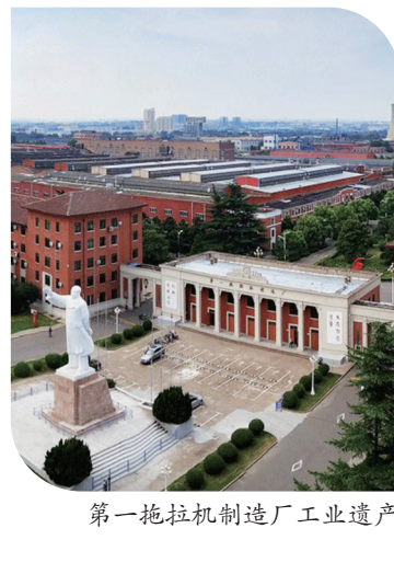
第一拖拉机制造厂工业遗产

本报讯(洛报融媒记者 张锐鑫 陈曦 郭学锋 通讯员 许利民)日前,国家文物局、工业和信息化部公布“共和国印记”见证物和工业遗产保护利用典型案例名单,100项“共和国印记”见证物和77项工业遗产保护利用典型案例上榜。我市4个项目榜上有名,占全省总数的80%。