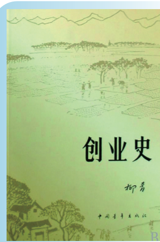
柳青代表作《创业史》