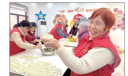
“把饺子包成元宝,吃一口福气肯定少不了。”为引领辖区国企党员进一

步坚定理想信念,增强党性修养,营造社区尊老敬老的祥和暖冬氛围,涧西区天津路街道电厂新村社区在党员活动室举行以“党员齐聚话暖冬 长桌饺子乐融融”为主题的长桌饺子宴。