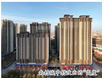
南村城中村改造的“高度”

量组走村入户,秉持“一把尺子量到底”的原则,确保了丈量工作的有序推进与精准无误,全部征迁房屋丈量顺利提前完成。5月27日,征迁安置补偿协议正式签订,仅3天时间,便有709户完成签约,签约户数占全村总户数的85%。这一高效成绩彰显出全体村民对南村城中村改造工作的高度认可与大力支持,也充分体现了此次征迁工作在程序与民意上的双重成功。