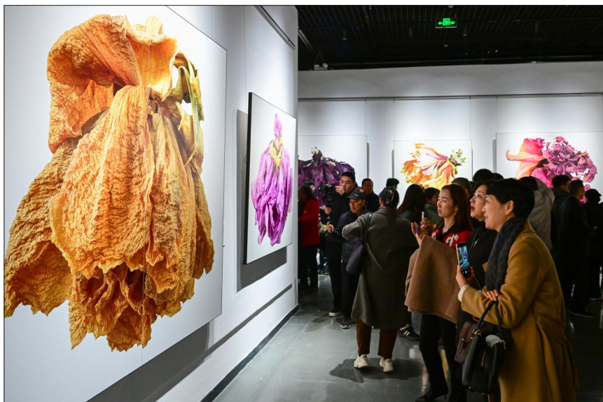
展览现场

“这40多年来,我选择了一个重点拍摄题材,那就是牡丹。拍就要拍到极致。”昨日,国色·九歌——王昆峰影像艺术展在洛阳博物馆开幕,这也是王昆峰多年创作的心血凝结。