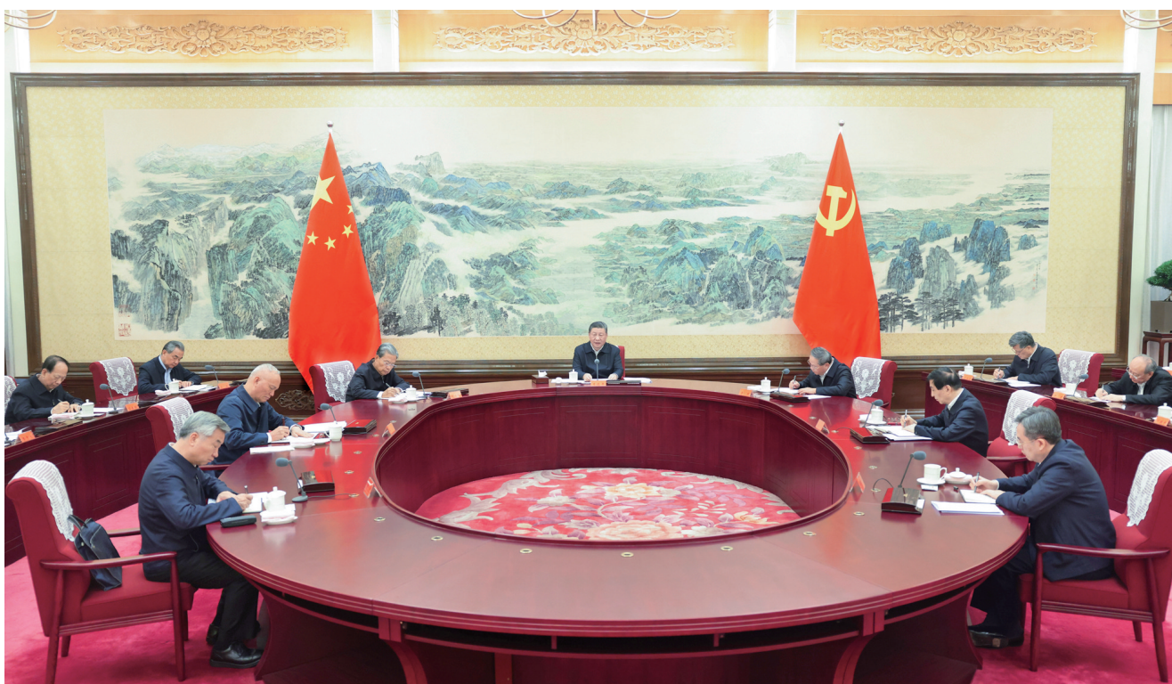
12月26日至27日,中共中央政治局召开民主生活会,中共中央总书记习近平主持会议并发表重要讲话。

新华社北京12月27日电 中共中央政治局于12月26日至27日召开民主生活会,深入学习贯彻习近平新时代中国特色社会主义思想,围绕巩固深化党纪学习教育成果、综合发挥党的纪律教育约束和保障激励作用,把学习贯彻纪律处分条例、落实中央八项规定情况作为检查的重要内容,结合思想和工作实际进行自我检视、党性分析,开展批评和自我批评。