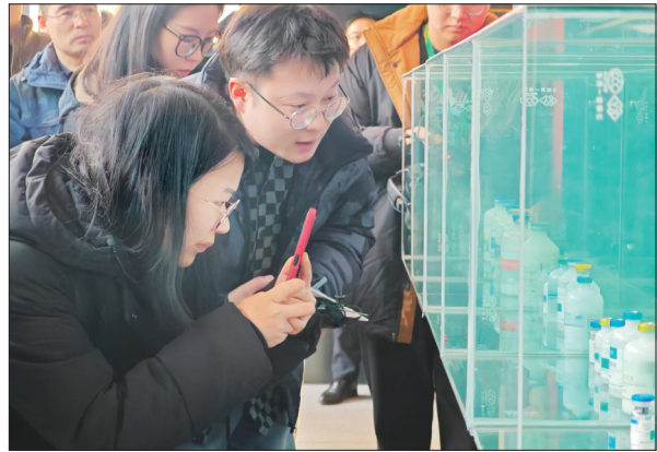
采访团成员采访普莱柯生物工程股份有限公司