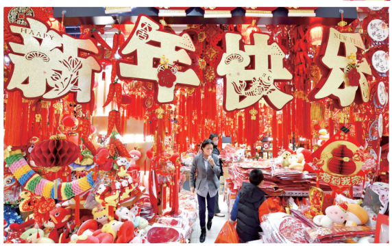
昨日,北京市民在购买新年装饰品

昨日是2024年的最后一天。岁序更替,华章日新。辞旧迎新之际,在祖国的各个角落,人们在平凡烟火中追寻生活的美好。