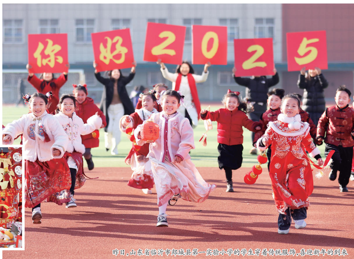
昨日,山东省临沂市郯城县第一实验小学的学生穿着传统服饰,喜迎新年的到来