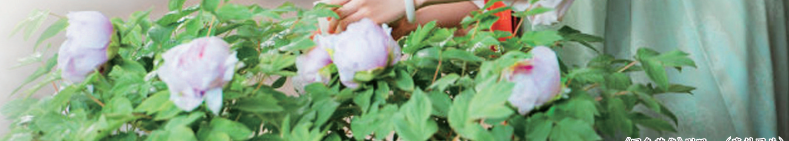
《国色芳华》剧照 (资料图片)