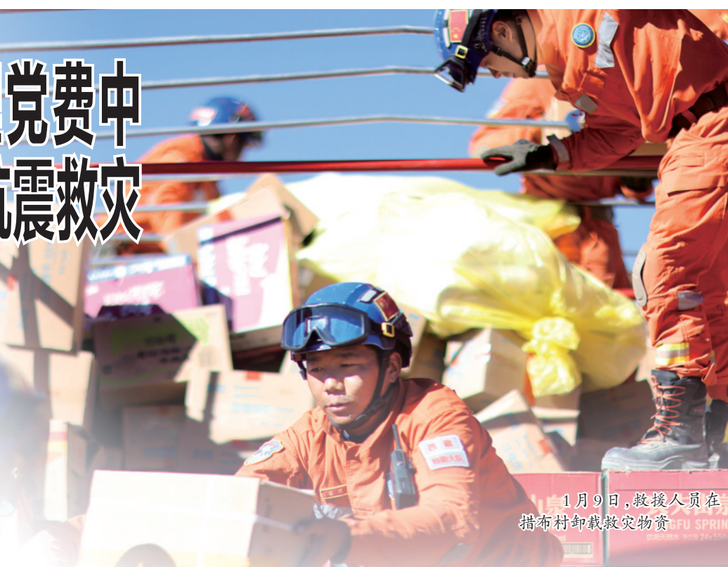
1月9日,救援人员在措布村卸救灾物资。

灾区党员、干部要深入抗震救灾第一线,到灾情最严重的地方去,到群众最需要的地方去,冲锋在最前沿、奋战在艰险处,做灾区人民的主心骨和贴心人。党组织部门要充分发挥动员和保障作用,注意在抗震救灾中考察和识别干部,注意发现、宣传基层党员、干部中的先进典型,为抗震救灾提供坚强组织保证。 中央组织部强调,这笔党费要及时拨付到灾区基层,做到专款专用,主要用于慰问奋战在抗震救灾第一线的基层党员、干部、群众,慰问因受灾严重而遇到生活困难的党员、群众,补助修缮因灾受损的基层党员教育设施。