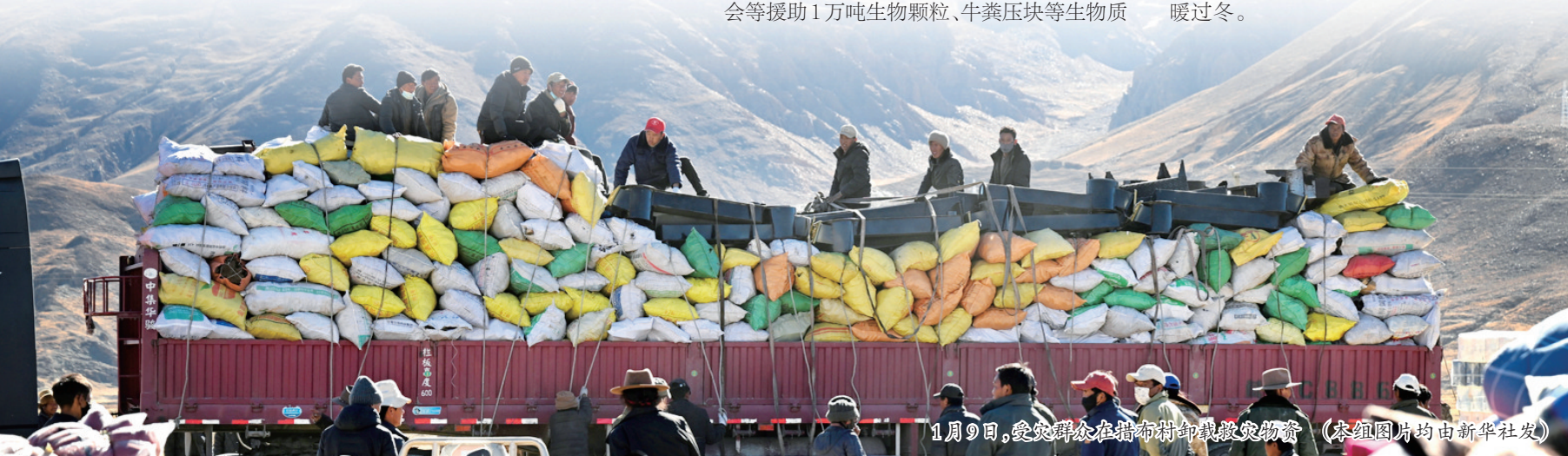
1月9日,受灾群众在措布村卸救灾物资。(本报图片均由新华社发)

期的该产妇从自家前往定日县医院做产检途中发生地震。8日1时30分,产妇被转运到日喀则市人民医院进行观察。经医院全面系统检查评估后,8日7时被送入产房分娩。目前母子平安,生命体征平稳。(新华社发)