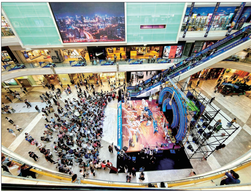
特色活动多 商场人气旺 (资料图片)

抓好企业服务保障。精准开展“万人助万企”活动,建立“领导干部+部门骨干+金融机构”服务专班,“一企一策”帮助企业解决问题。开展“推动民营企业春节后复工复产”专项行动,做好满负荷生产奖励政策宣传落实,针对重点行业及178家骨干企业组织入企宣传,鼓励企业春节期间保持连续生产,节后尽快恢复生产。