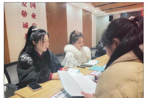
求职者与汉服门店人员面对面交流

15日午后,家住老城区的朵女士顾不上休息,便早早出了家门。她要到离家不远的赵春娥纪念馆职工大讲堂,参加一场就业援助招聘会。