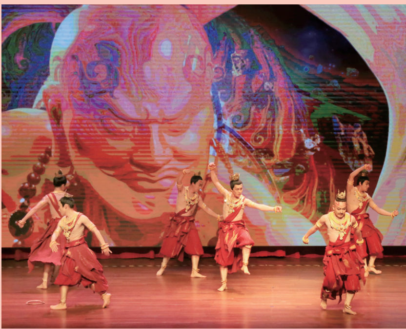
《龙门金刚》团队传播洛阳文化