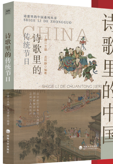
《诗歌里的传统节日》