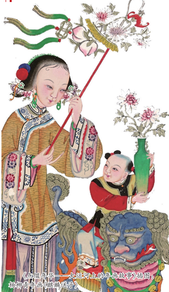
《点绛年华——大运河上的年画故事》插图: 杨柳青年画《麒麟送子》