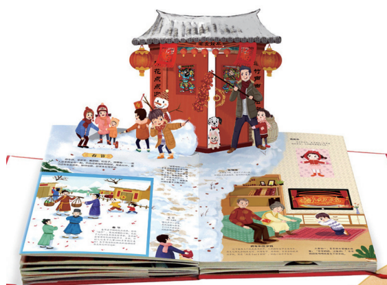
《中国传统节日立体书》内页 (本版图片均为资料图片)