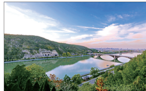
龙门水光山色(资料图片)

本报讯(洛报融媒首席记者 白云飞)日前,水利部公布2024年全面推行河湖长制典型案例,《守一方碧水 为一城增绿——河南省洛阳市以水生态综合治理助力城市高质量发展》案例成功入选。这是我市治水实践连续两年入选水利部典型案例,为各地治水兴水提供了“洛阳经验”。